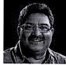
उच्च शिक्षा मंत्री राजस्थान सरकार जयपुर

कार्यालय : 6103, मंत्रालयिक भवन, शासन सचिवालय, जयपुर दूरभाष : 0141-2227073 ईमेल : minister.rsmg2018@gmail.com